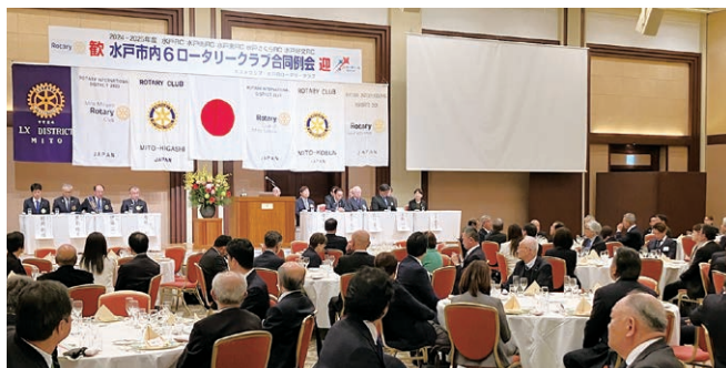
水戸市内6RC合同例会の様子