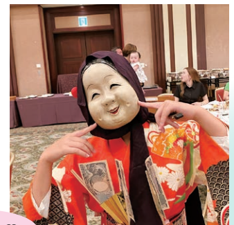
おひねりあげました♡