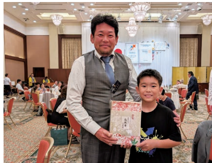
松阪牛ゲットの録田親子