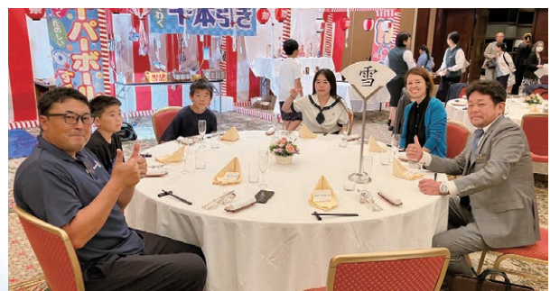
録田家 with N