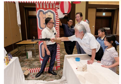
孫の為に頑張る赤岩会員