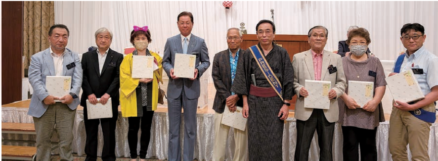
8月お誕生日の皆様