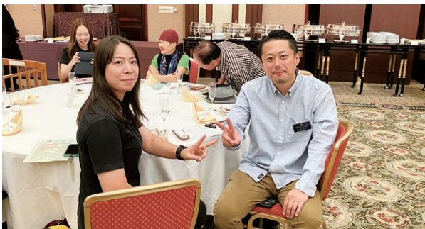
Sayonara Tokyo (Vo&Key) でご活躍の桑名会員ご夫妻