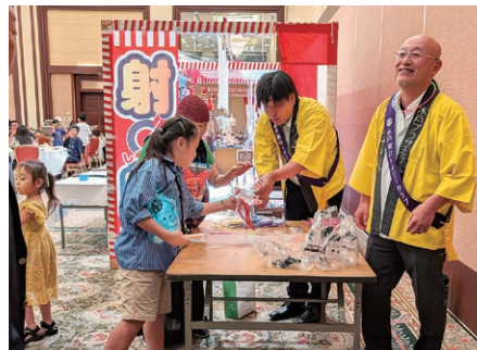
子供達への色々グッズを渡す親睦活動委員会の皆さん