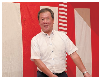
谷島親睦活動委員長もお疲れ様でした