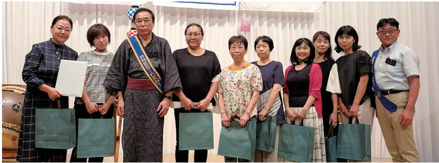
おひさま食堂ボランティアの皆様