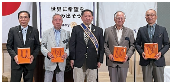
親睦の時間「5月誕生日祝い」