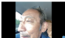
9月15日誕生日 及川会員、おめでとうございます