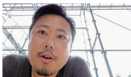
9月4日誕生日 桑名会員、おめでとうございます