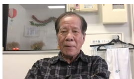
9月27日誕生日 野口会員、おめでとうございます